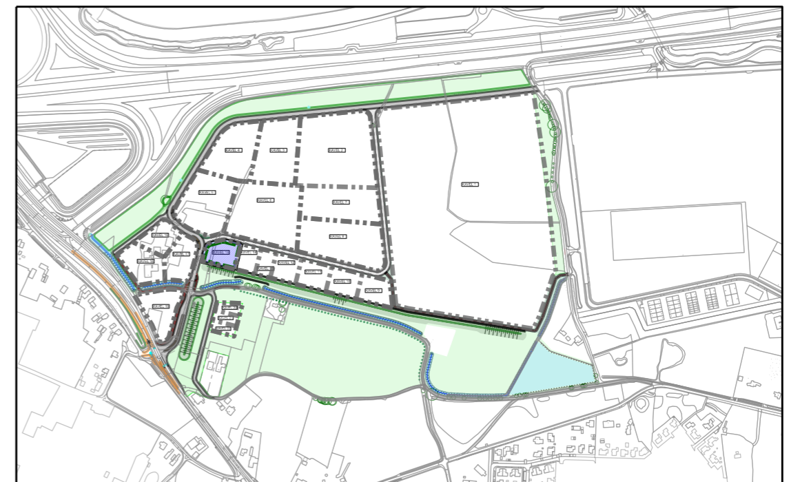
Situatie, schaal 1: 10.000

Voor toelichting en overige eisen zie bestemmingsplan Chw A1 Bedrijvenpark 2020 en beeldkwaliteitsplan A1 Bedrijvenpark