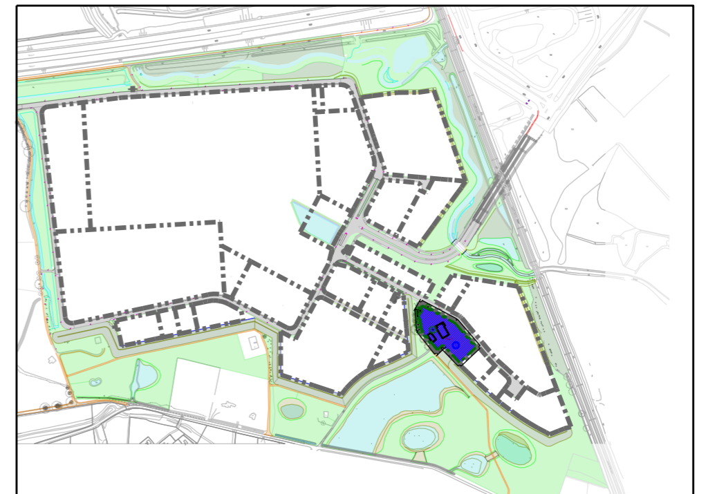
Situatie- schaal 1: 10.000